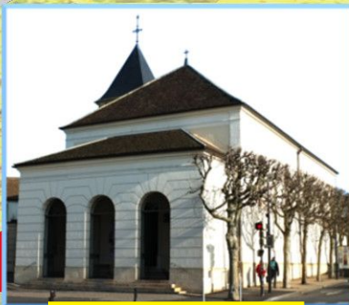
Saint Remy (Draveil)

Pour les personnes à mobilité réduite, prévoir de rejoindre les marcheurs en voiture aux différentes églises.