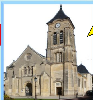
Notre Dame de l'Assomption (Soisy)