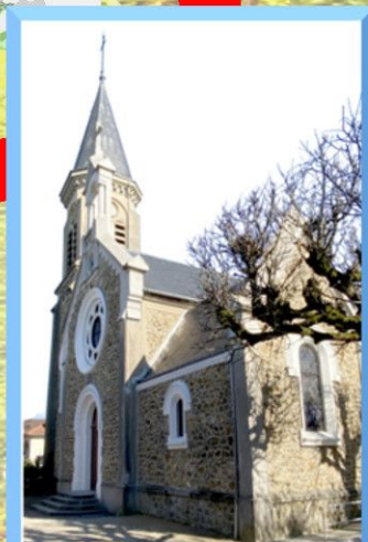
Saint Pierre es Liens (Vigneux)